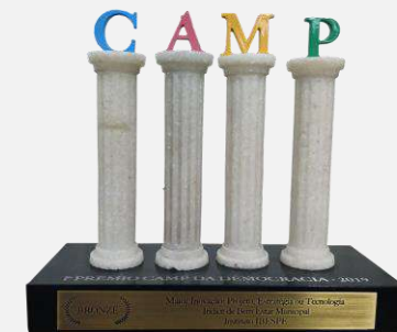
CATEGORIA: MAIOR INOVAÇÃO: PROJETO, ESTRATÉGIA E TENOLOGIA (IBEM)