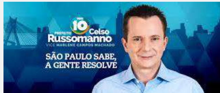
ELEIÇÃO PARA O MUNICÍPIO DE SAO PAULO 2016

Aliando sua experiência acadêmica à especialização profissional na condução de estudos de gestão pública e eleitoral, o IBESPE passou a ser contratado para as principais eleições do Brasil, como as eleições para a Cidade de São Paulo com 12,2 milhões de habitantes e para a eleição do Governador do Estado de São Paulo com 44,1 milhões de habitantes.