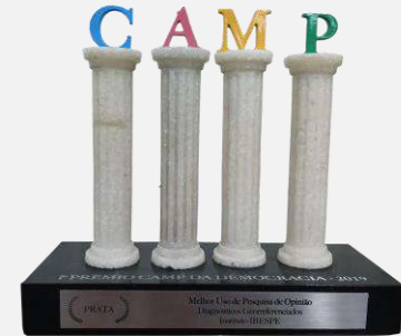
CATEGORIA: MELHOR USO DE PESQUISAS ELEITORAIS (PLANEJAMENTO DE CAMPANHA)