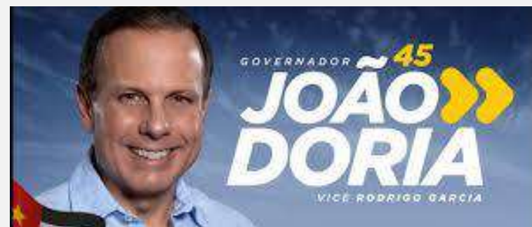
ELEIÇÃO PARA O GOVERNO DE SÃO PAULO 2018